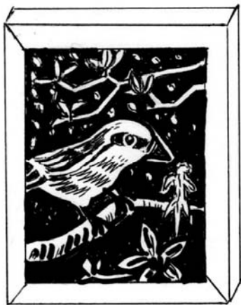
木版画制作(葉書きサイズ)全4回