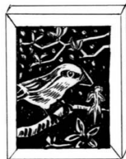
木版画制作(葉書サイズ)(3～4回)